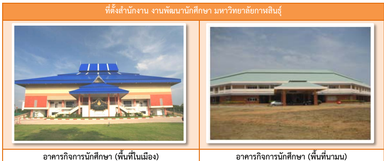
รูปที่ ๑.๑ สถานที่ตั้งสำนักงานอาคารกิจการนักศึกษา มหาวิทยาลัยกาฬสินธุ์

พื้นที่นามน ณ อาคารกิจการนักศึกษา มหาวิทยาลัยกาฬสินธุ์ เลขที่ ๑๓ หมู่ ๑๔ บ้านห้วยแก้ว ตำบลสงเปลือย อำเภอนามน จังหวัดกาฬสินธุ์ ๔๖๒๓๐ โทรศัพท์ ๐-๔๓๖๐-๒๐๕๐