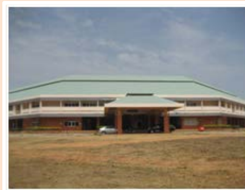
อาคารกิจการนักศึกษา (พื้นที่นามน)

รูปที่ 1.1 สถานที่ตั้งสำนักงานอาคารกิจการนักศึกษา มหาวิทยาลัยกาฬสินธุ์