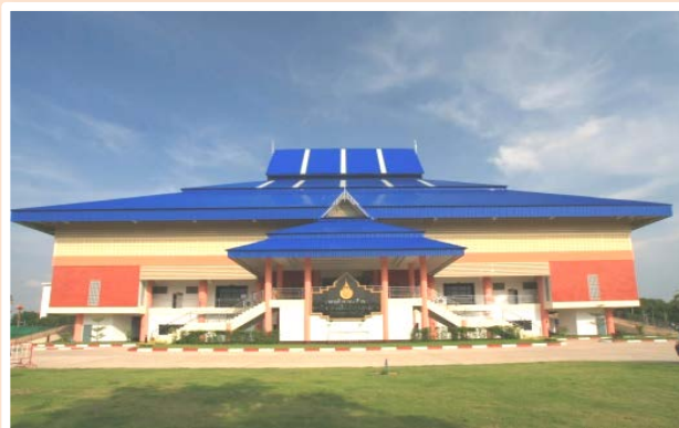
อาคารกิจการนักศึกษา (พื้นที่ในเมือง)